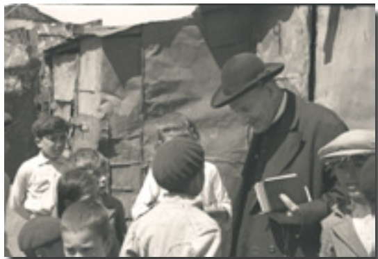
O P. Cruz visita os bairros pobres de Lisboa, 9.7.1937

É admirável o zelo apostólico do nosso Padre Cruz. Tinha um coração universal e dedicava-se de alma e coração ao seu ministério sacerdotal. Todos: doentes, presos, até os inimigos, encontravam nele um amigo sempre dedicado e generoso. As suas muitíssimas viagens por Portugal inteiro sempre com o desejo de ir pregar, confessar, visitar doentes, levar esmolas para os mais pobres, rezar com as comunidades, ajudar a adorar Jesus no Santíssimo Sacramento, falar sempre, oportuna e inoportunamente, do tesouro do seu coração: Jesus Cristo, Nossa Senhora, os sacramentos e sua riqueza espiritual, o amor à Igreja e ao Papa. Vivia a caridade pastoral numa total dedicação, num zelo indomável, não olhava ao cansaço, à dureza das viagens, ao incómodo de estar horas e horas a confessar.