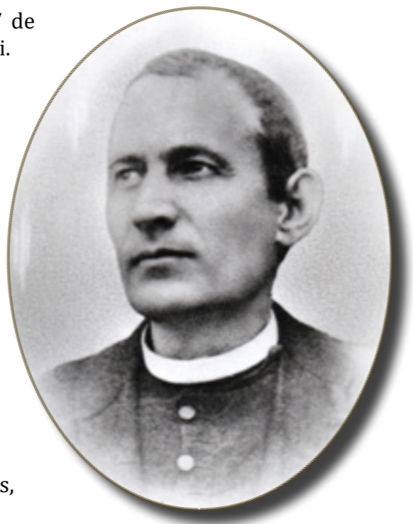
Padre Cruz Seminário de S. Vicente de Fora, Lisboa (1900-1903)