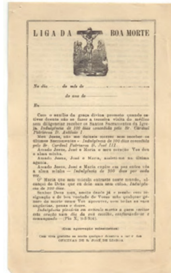
Pagela da Liga da Boa Morte

Quando se realiza uma lotaria, e principalmente quando o prémio é maior, as pessoas habilitadas desejam ardentemente que lhes saia a sorte grande e só um número terá essa sorte; para quem tem a felicidade de ter fé numa santa morte, é a sorte grande do céu, que vale infinitamente mais que todas as riquezas da terra, e esta sorte grande todos a podem obter, desejando eficazmente empregar os meios necessários; ora um dos meios é fazer essa promessa, e quando o fizerem procurarem fazer uma confissão geral, desde a sua infância e depois ter o bom hábito de se confessarem todos os meses e comungarem nos dias que puderem, principalmente na primeira sexta-feira em honra do Sagrado Coração de Jesus, no primeiro sábado e dia 13 em honra de Nossa Senhora, cujo terço devem rezar diariamente e trazer com muita devoção o seu bendito escapulário. Não basta prepararmo-nos para morrer, quando chegar a morte; é necessário já estarmos bem preparados de longe (S. Afonso N. de Ligório).”