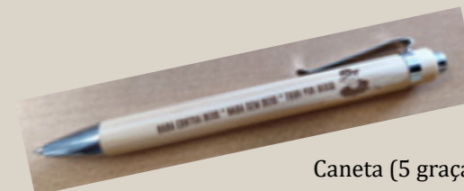
Caneta (5 graças)