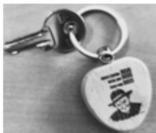
Porta-chaves: 3,17cm x 5,5cm (5 graças)