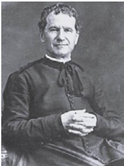
S. João Bosco, fundador dos Salesianos (1815-1888)