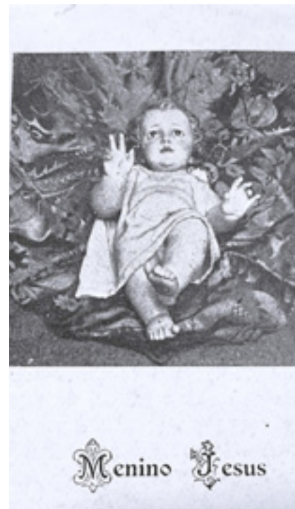
Uma estampa do «Nascimento de Jesus»